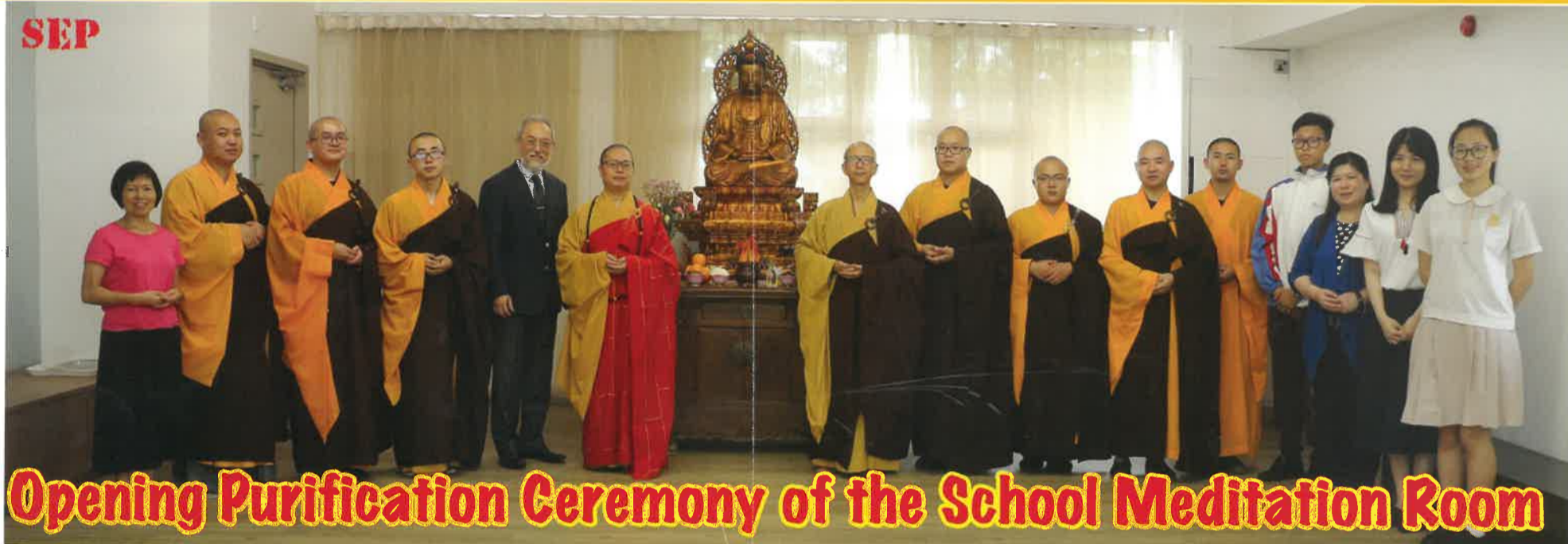
Opening Purification Ceremony of the School Meditation Room