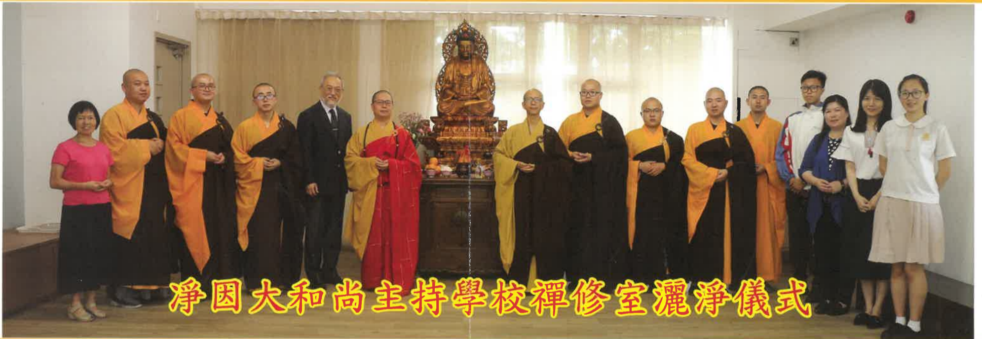
淨因大和尚主持學校禪修室灑淨儀式